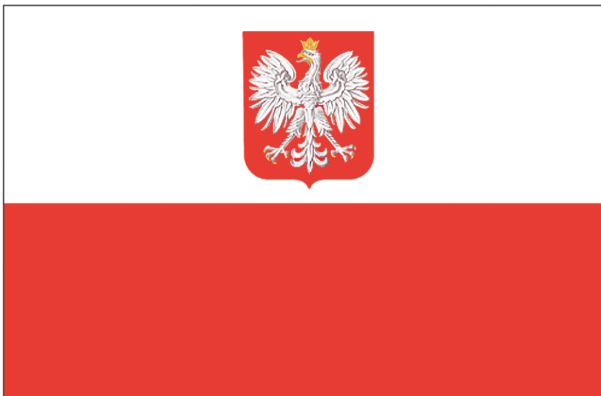
FLAGA PAŃSTWOWA RZECZYPOSPOLITEJ POLSKIEJ

Stosunek wysokości godła do szerokości flagi – wynosi 2:5